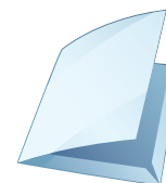
Chemises à rabat