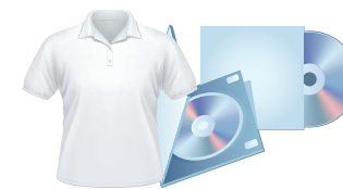
Textiles /Objets publicitaires