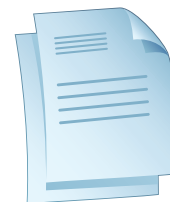
Têtes de lettre